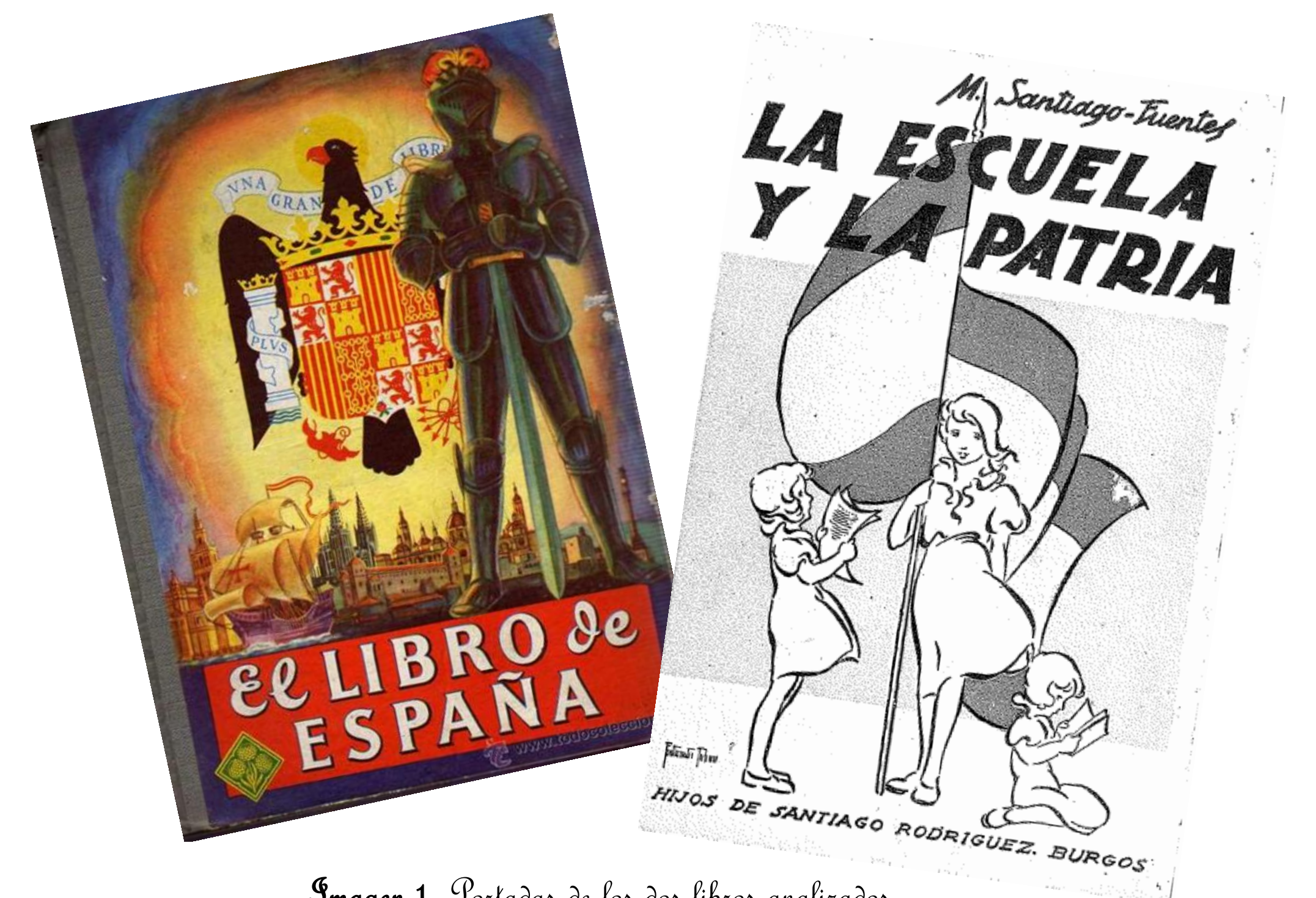
Imagen 1. Portadas de los dos libros analizados