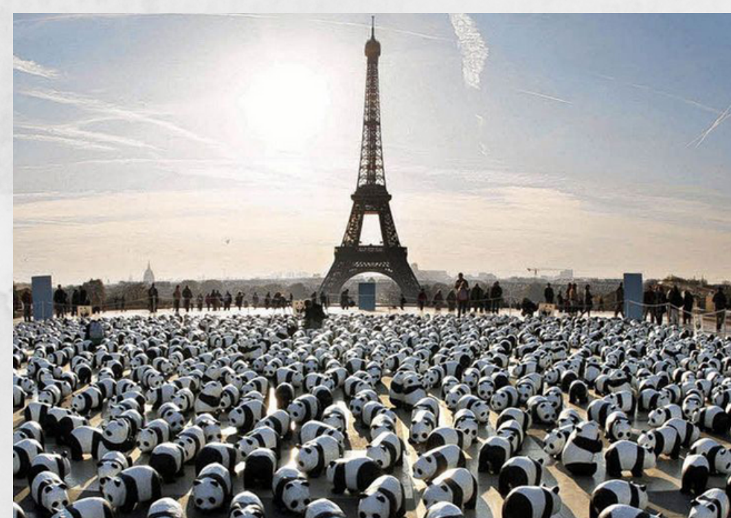
Paulo Grangeon, Pandas de viaje