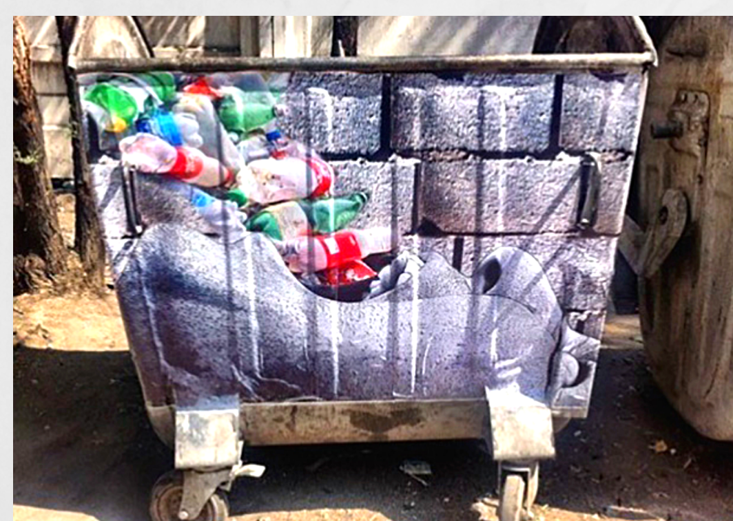
Aida Sulova, Botes de basura