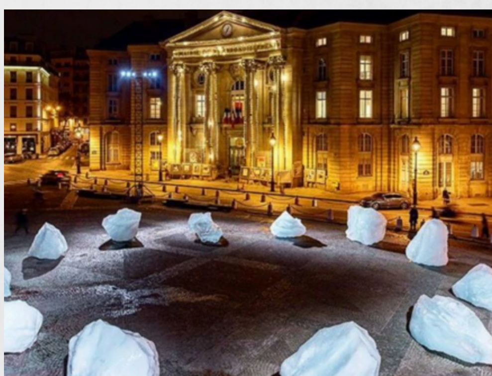
Olafur Eliasson, Tu pérdida de tiempo